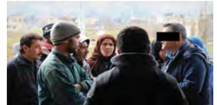
Asociados de VDLM a través del Medio Oriente comparten el amor de Cristo con refugiados sirios.