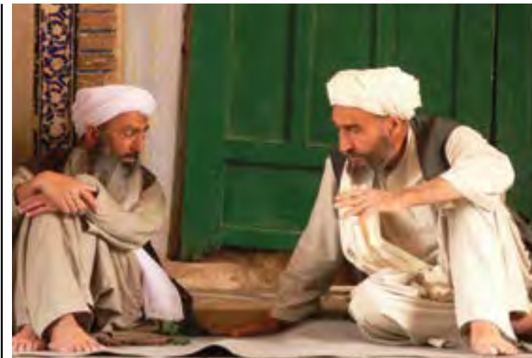
Obaid, estaba listo para enfrentar el interrogatorio y posible ejecución en su mezquita local.

“Estoy en Afganistán y voy por ti”, decía uno. “Di mi vida a Alá y voy por ti”,