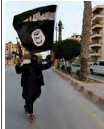
Un soldado de ISIS celebra después de que tomaran control de Mosul.

oriente nunca han enfrentado tan graves circunstancias en tiempos modernos. Pero a pesar de las dificultades y tragedias, Dios continúa construyendo su preciosa iglesia a través del lugar de nacimiento del cristianismo.